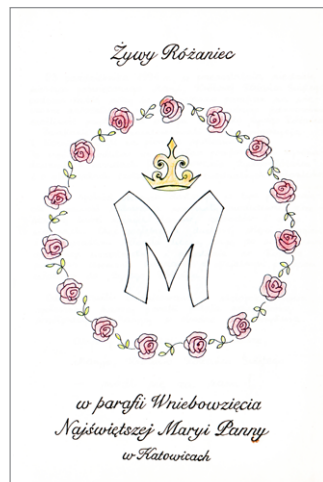
Pierwsza strona kroniki (księgi różańcowej) Żywego Różańca naszej parafii