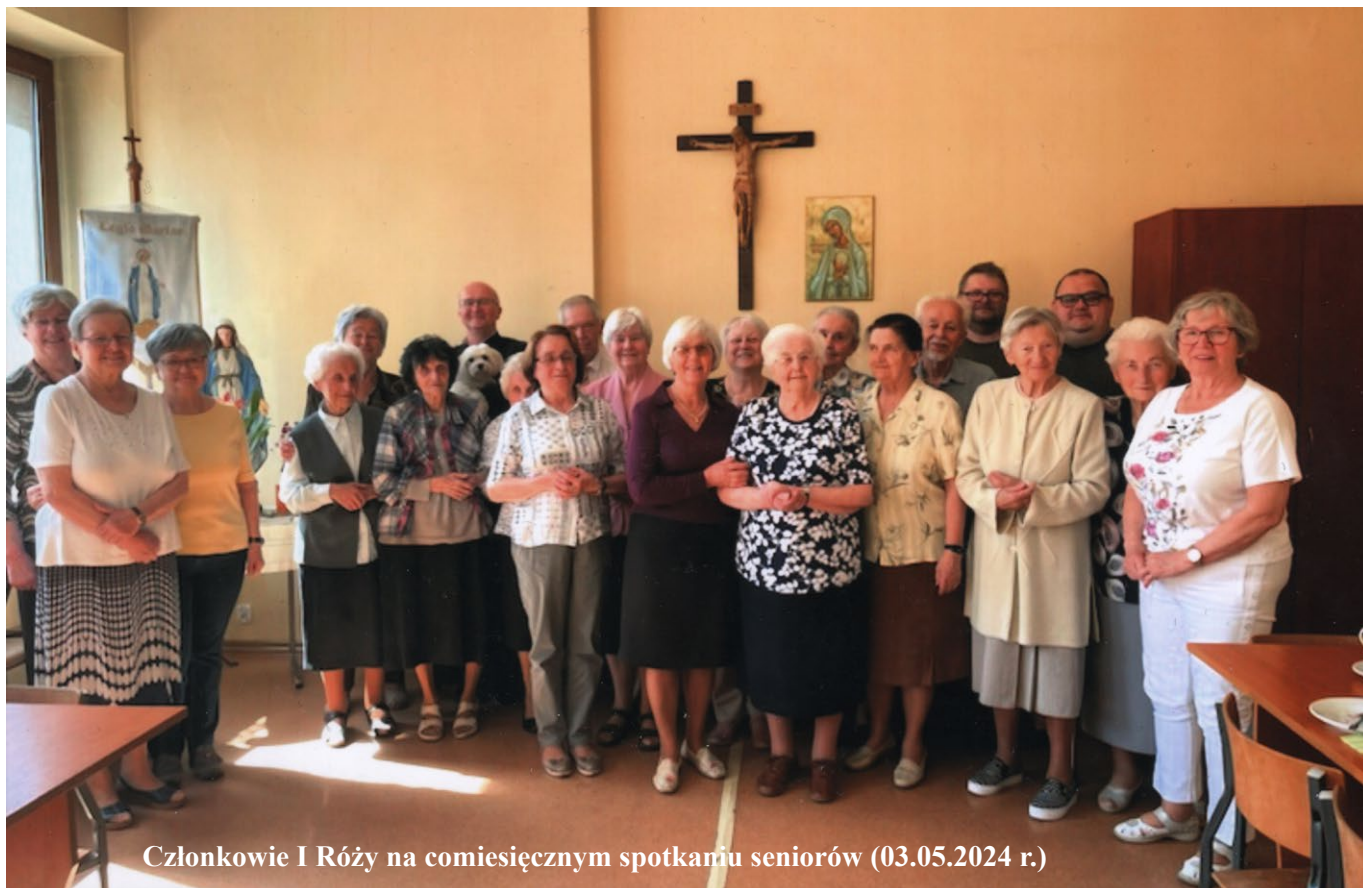
Członkowie I Róży na comiesięcznym spotkaniu seniorów (03.05.2024 r.)

z terenu naszej parafii, ale także z parafii ościennych: mariackiej, Bogucic, Zawodzia, a nawet spoza Katowic.