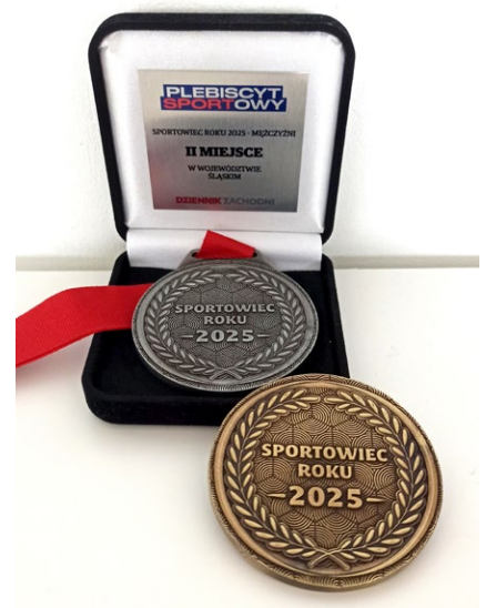
W Katowicach – złoto, w województwie – srebro